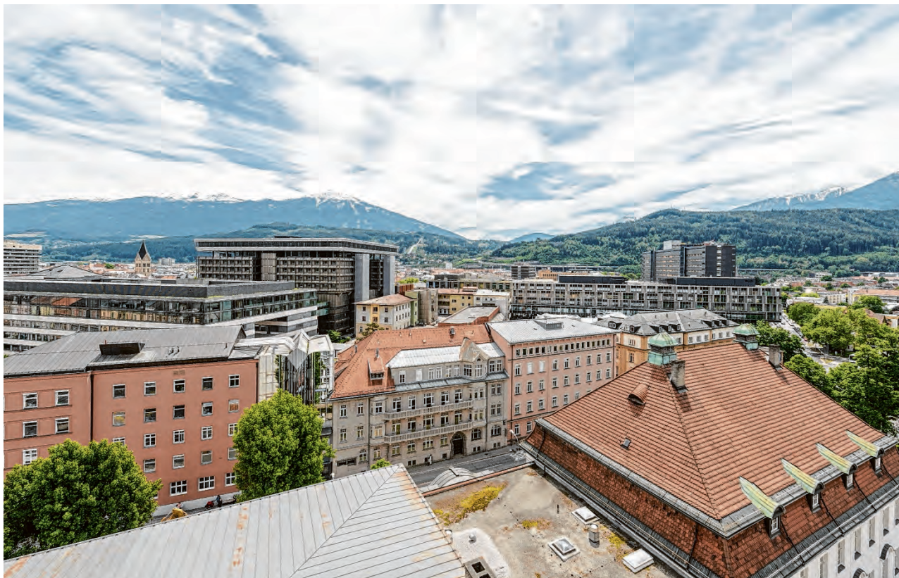
Forschen, lehren, heilen – ein umfassender Aufgabenbereich der Medizin Uni Innsbruck am Wissenschafts- und Gesundheitsstandort Tirol.

Auch wenn Krankenversorgung primär die Aufgabe der Länder ist, übernimmt die Medizin Uni Innsbruck als Bundeseinrichtung hier ebenso eine finanzielle Verantwortung. Es fließen in Summe über die Gehälter der über 400 Bundes-ÄrztInnen, die neben Forschung und Lehre an der Krankenversorgung mitwirken, und dem – zwischen Bund und Land verhandelten – Klinischen Mehraufwand (KMA) jährlich ca. 130 Millionen Euro direkt und indirekt in die Tiroler Krankenversorgung. „Unsere Ärztinnen und Ärzte leisten neben ihren universitären Aufgaben hervorragende Arbeit in der direkten Krankenversorgung“, so Fritsch. Dabei bildet das Aufgabenspektrum der Medizin Uni die Voraussetzung: „Die